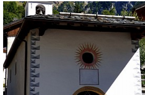
MNPC OT Peisey-Vallandry

Contact : Téléphone : 04 79 07 94 28 Email : info@peisey-vallandry.com Site web : http://www.peisey-vallandry.com