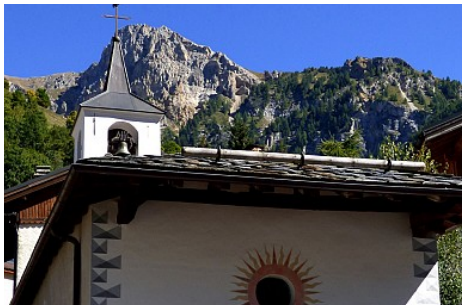
MNPC OT Peisey-Vallandry

La messe y est dite quelques fois dans l'année.