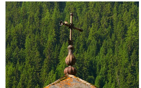
OT PV M-N Pocard Chapuis

Contact : Téléphone : 04 79 07 94 28 Email : info@peisey-vallandry.com Site web : http://www.peisey-vallandry.com