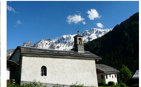
Office de tourisme de Peisey Vallandry

Contact : Téléphone : 04 79 07 94 28 Email : info@peisey-vallandry.com Site web : http://www.peisey-vallandry.com