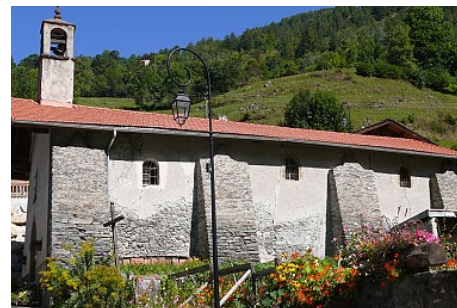
MNPC OT Peisey-Vallandry

Sainte Agathe "arriva" en Savoie où elle fut invoquée contre les incendies dans les villages et devint aussi la patronne des jeunes mères et des nourrices.