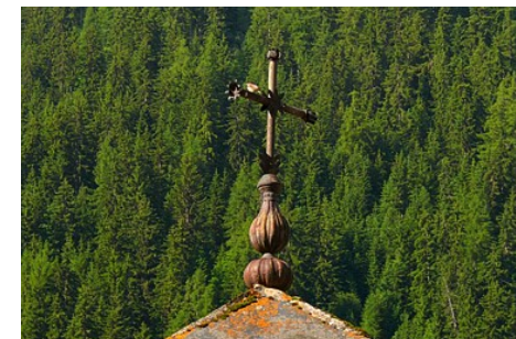
OT PV M-N Pocard Chapuis

Contact : Téléphone : 04 79 07 94 28 Email : info@peisey-vallandry.com Site web : http://www.peisey-vallandry.com