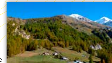
Hameau « les Lanches »