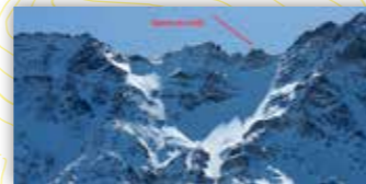
Les Dames de midi