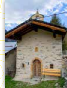
Chapelle de Beaupraz